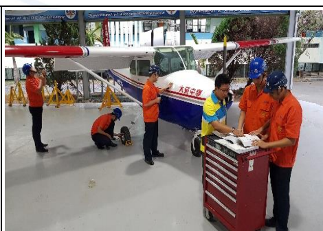
飛機修護丙級檢定場地