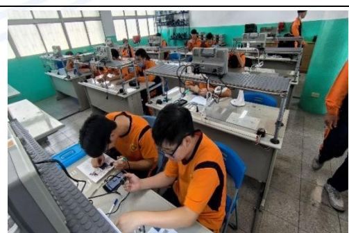
工業電子丙級檢定場地