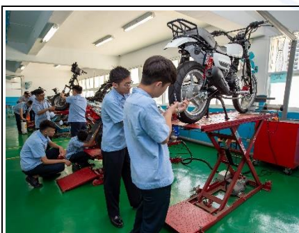
機踏車修護丙級檢定場地