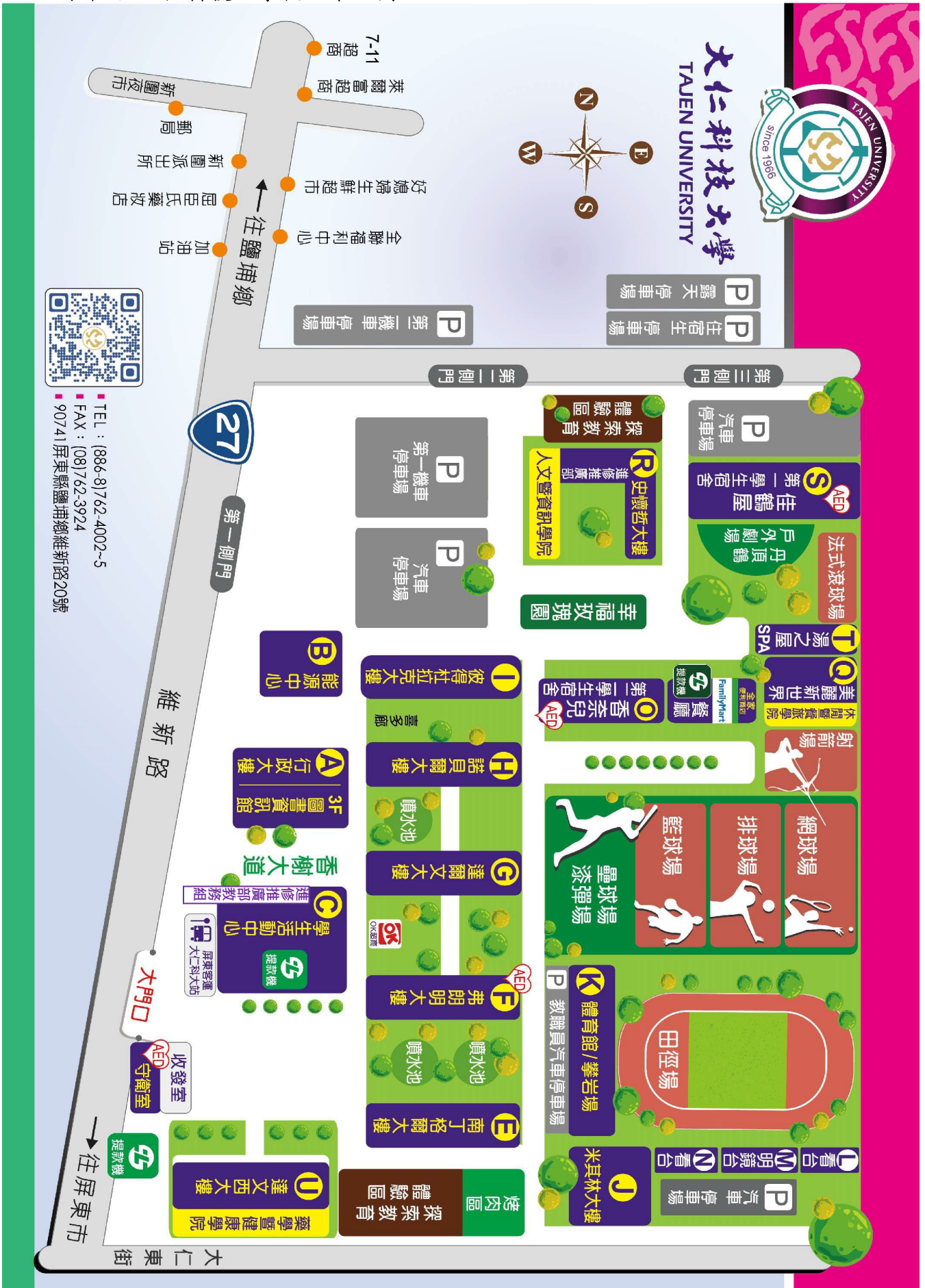
附件九 大仁科技大學校區平面圖