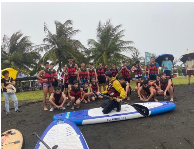
SUP 水域活動體驗教學