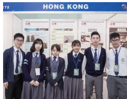
香港 Hong Kong