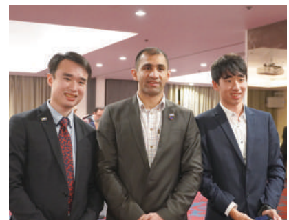
英國 United Kingdom