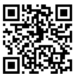
大園高中國際處 官方網站