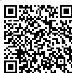
國際文憑課程專班 入學管道