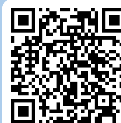
大園高中國際處 FB粉絲專頁