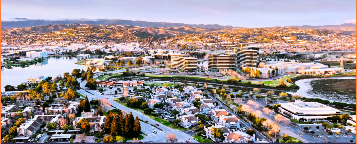
矽谷之旅 Silicon Valley