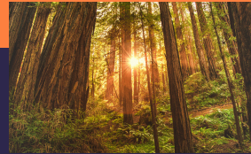
穆爾國家森林公園